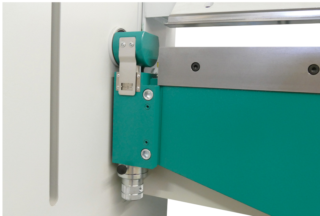
Einstellung des Biegeradius über Drehnocke

Bei den PTS-Modellen verfügt die Maschine über eine gesteuerte Z-Achse, die für die Klemmung zuständig ist. Dies bietet eine höhere Genauigkeit und Flexibilität bei der Positionierung und Anpassung des Werkstücks und erleichtert komplexere Biegeoperationen.