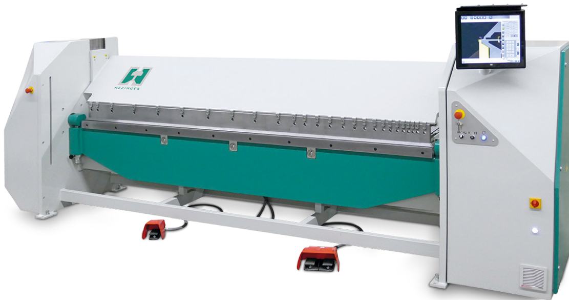
Beispiel PTSL-3100-30 mit grafischer Steuerung