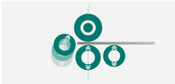
1. Blech einlegen und ausrichten, die Seitenwalze dient als Anschlag