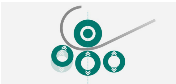
3. Einrunden bis zur Übergabe an die andere Seitenwalze