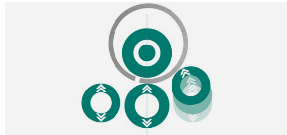
4. Zweite Anbiegung am Ende der Rundung